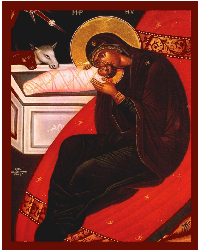
(ΓΕΝΝΗΣΙΣ ΚΥΡΙΟΥ, ΑΓΙΟΣ ΓΕΩΡΓΙΟΣ ΚΟΝΤΟΥ, ΛΑΡΝΑΚΑ)

Ο Χριστός ταπεινώνεται από αγάπη για μας, παίρνει τη δική μας μορφή και έρχεται να μας συναντήσει, να μας αγκαλιάσει, να κάνει τον πόνο και τα προβλήματά μας δικά Του. Έρχεται να γιατρέψει τις πληγές μας και να χαρίσει στις πονεμένες μας καρδιές την αληθινή ειρήνη, την αληθινή χαρά και την αληθινή αγάπη. Γίνεται για μας πατέρας, αδελφός, φίλος μέχρι και υπηρέτης μας, παραμένοντας όμως ταυτόχρονα και πάντα Θεός.