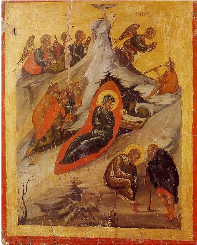
(ΚΕΝΤΡΙΚΗ ΓΕΝΝΗΣΙΣ ΚΥΡΙΟΥ, ΑΓΙΟΣ ΝΕΟΦΥΤΟΣ, ΠΑΦΟΣ)

Οκτώ ημέρες μετά την Αγία Γέννηση εκ Παρθένου, οι γονείς του Χριστού τον οδήγησαν στον τόπο όπου οι Ιουδαίοι τελούσαν την περιτομή. Κατά την περιτομή έλαβε και το όνομα Ιησούς, το οποίο έδωσε ο άγγελος πριν ακόμη συλληφθεί από την